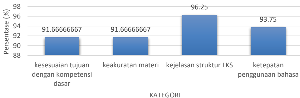
Gambar 3. Penilaian Validator terhadap LKS

Berdasarkan rata-rata penilaian RPP, buku ajar, dan LKS, maka buku yang dikembangkan inisudah memenuhi standar kualitas seperti yangdipersyaratkan oleh BSNP dan sesuaikurikulum 2013 sehingga buku ini dapatdigunakan untuk guru dan siswa sekolahSMP/MTs. Selain itu, perangkat pembelajaran yang dikembangkan sudah terintegrasi dengan lingkungan sekitar siswa. Apabila dirata-ratakanmenunjukkan kualitas RPP, buku ajar, dan LKS berturut-turut sebesar 95,83%, 91,67%, dan 93,75%. Hal ini menunjukkan bahwa kualitasRPP, buku ajar, dan LKS pembelajaranIPA berbasis lingkungansudah layak diuji coba di kelas.