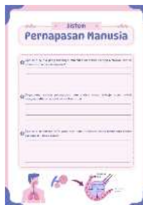
Gambar 4. LKPD Algoritma

Dalam praktiknya, siswa diajarkan secara sederhana menggunakan kartu bergambar sistem pernapasan, video animasi dan juga lembar kerja peserta didik untuk menjelaskan kerja sistem pernapasan. Aktivitas ini menumbuhkan rasa