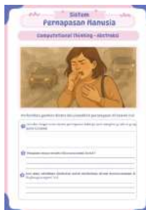
Gambar 2. LKPD Computational Thinking Abstraksi

dengan mengabaikan detail-detail lain yang tidak diperlukan. Langkah ini penting untuk membantu siswa dalam memahami inti dari permasalahan secara lebih efisien serta membuat solusi yang lebih umum serta dapat digunakan kembali. Dengan menggunakan abstraksi, siswa dapat menciptakan model atau representasi yang lebih sederhana, sehingga proses analisis dan pemecahan masalah menjadi lebih terstruktur dan mudah diterapkan.