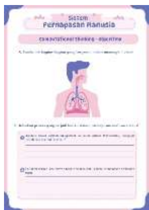
Gambar 3. LKPD Algoritma