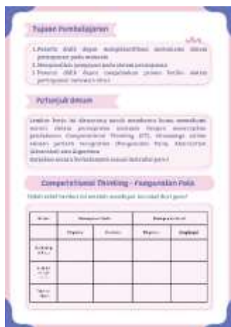
Gambar 1. LKPD Computational Thinking Pengenalan Pola

Langkah yang kedua dalam computational thinking adalah pengenalan pola. Pengenalan pola dalam computational thinking adalah langkah di mana kita mencari kesamaan atau pola yang muncul dari suatu masalah atau situasi. Dengan mengenali pola, siswa bisa memahami proses terjadinya suatu hal dan memprediksi apa yang akan terjadi selanjutnya. Pengenalan pola dilakukan dengan memberikan video singkat mengenai mekanisme sistem pernapasan. Melalui lembar kerja peserta didik (LKPD) siswa mengidentifikasi perbedaan atau pola antara pernapasan dada dan pernapasan perut saat ekspirasi dan inspirasi.