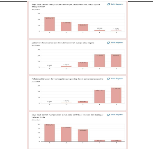
Gambar 4. Respon hasil instrumen penelitian

Dengan demikian, hasil pengembangan instrumen ini menunjukkan bahwa instrumen yang dikembangkan untuk mengukur pandangan guru terhadap sifat-sifat sains memiliki validitas dan reliabilitas yang memadai. Validitas isi, konstruksi, dan kriteria menunjukkan bahwa instrumen dapat diandalkan untuk mengukur konstruk yang dimaksud. Selain itu, hasil pengujian reliabilitas menunjukkan bahwa instrumen memberikan hasil yang konsisten dan dapat diulang. Dengan demikian, instrumen ini siap digunakan dalam penelitian lebih lanjut