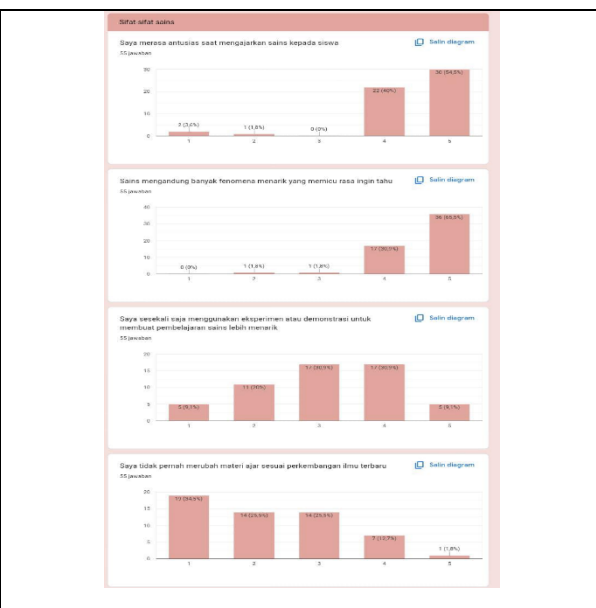
Gambar 2. Respon hasil instrumen penelitian