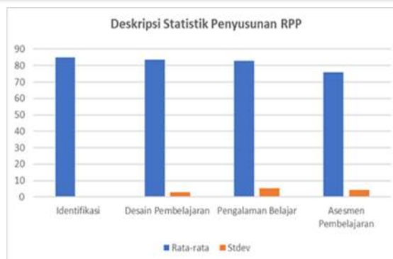
Gambar 1. Deskripsi Statistik Penyusunan RPP

Asesmen Pembelajaran (asesmen awal, proses, dan akhir). Pada bagian ini menunjukkan variasi cukup besar (rata-rata 76,05, standar deviasi 4,27). Variasi cukup besar juga memperlihatkan bahwa sebagian mahasiswa masih cenderung menggunakan asesmen tradisional berbasis tes kognitif, sementara sebagian lainnya sudah mulai mencoba asesmen performa atau portofolio. Hasil statistik deskriptif diperoleh komponen RPP menggunakan model RADEC berbasis pembelajaran mendalam mahasiswa dalam menyusun RPP seperti pada Gambar 1 berikut.