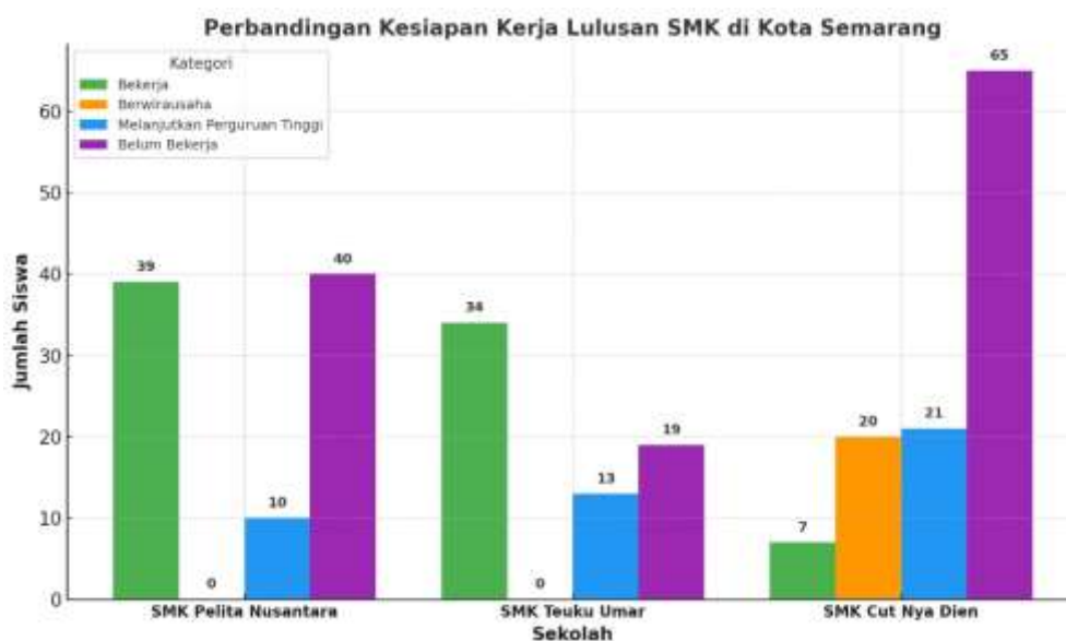
Gambar 2. Data Tracer Study 2023-2024

Kebudayaan, Riset dan Teknologi diketahui Jurusan Manajemen Perkantoran dan Layanan Bisnis yang ada di Kota Semarang sebanyak 12 sekolah. Peneliti mengambil 3 sekolah sebagai perwakilan untuk mengetahui data kesiapan kerja 2 tahun berturut-turut berdasarkan tingkatan klaster melalui data yang diberikan oleh BKK (Bursa Kerja Khusus).