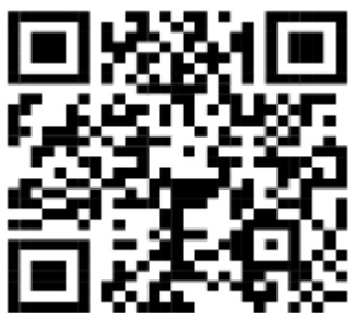
Gambar 1. QR-Code Lab.Fisika

Setelah konten informasi disusun, tahap berikutnya adalah pembuatan QR Code dengan mengonversi tautan informasi digital menggunakan aplikasi QR Code Generator. QR Code merupakan kode gambar dua dimensi tercetak yang mampu menyimpan sejumlah informasi (Law, 2010). Teknologi ini memiliki keunggulan karena dapat menyimpan berbagai jenis data, seperti data numerik, alfanumerik, biner, serta karakter kanji dan kana (Musthofa et al., 2016). QR Code yang dihasilkan kemudian diuji untuk memastikan dapat dipindai dan diakses dengan baik.