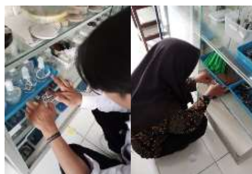
Gambar 4. Pemasangan QR-Code

Code ditempelkan pada bagian alat yang mudah terlihat dan dijangkau pengguna tanpa mengganggu fungsi maupun keamanan alat. Setelah dipindai menggunakan smartphone, QR Code menampilkan halaman panduan digital dalam format PDF yang dapat diakses secara langsung. Tampilan digital tersebut memperlihatkan struktur panduan yang telah disusun, mulai dari cover hingga tips perawatan alat, sehingga pengguna dapat memperoleh informasi secara menyeluruh tanpa harus membuka buku manual cetak.