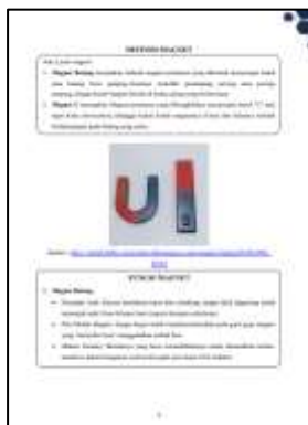
Gambar 3. Panduan Lab. Fisika

Panduan digital juga menyajikan gambar alat sebagai visualisasi alat secara utuh, yang dilengkapi dengan penjelasan komponen untuk menguraikan bagian-bagian penting alat, seperti tombol, skala ukur, atau probe. Penyajian visual dan deskripsi komponen ini sejalan dengan fungsi alat peraga sebagai sarana bantu untuk memperjelas materi melalui praktik langsung (Amiruddin & Wahyono, 2023). Selain itu, panduan memuat cara kerja alat yang disusun dalam bentuk teks prosedural untuk memberikan langkah-langkah pengoperasian alat secara sistematis. Kemampuan siswa dalam menggunakan alat-alat praktikum merupakan kompetensi penting dalam pembelajaran fisika, sehingga keberadaan panduan operasional ini dapat mendukung penguasaan keterampilan praktikum secara mandiri (Mirdayanti & Murni, 2017). Pada bagian akhir panduan, disertakan tips perawatan alat yang berisi panduan pemeliharaan agar alat tetap dalam kondisi baik dan tidak cepat rusak. Perawatan merupakan kegiatan penting untuk menjaga fasilitas agar tetap berada pada kondisi yang dapat diterima dan siap digunakan kembali (Arsyad & Sultan, 2018).