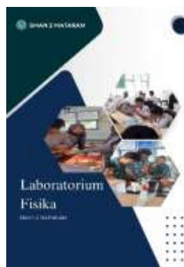
Gambar 2. Cover Panduan Lab. Fisika

sehingga memungkinkan akses informasi secara cepat dan praktis melalui perangkat smartphone (Sulistiyorini et al., 2022). Struktur panduan digital diawali dengan bagian cover yang memuat identitas visual alat praktikum. Cover berfungsi sebagai sampul awal yang memberikan kesan pertama serta menarik perhatian pengguna terhadap isi panduan (Galingging, 2020). Dalam konteks desain grafis digital, cover tidak hanya berperan sebagai pelindung konten, tetapi juga sebagai elemen visual yang membangun identitas dan daya tarik informasi (Dini & Selina, 2024). Desain cover disusun menggunakan platform Canva dengan memperhatikan aspek komposisi, pemilihan warna, serta penggabungan elemen desain agar tampilan panduan lebih menarik dan komunikatif (Dini & Selina, 2024).